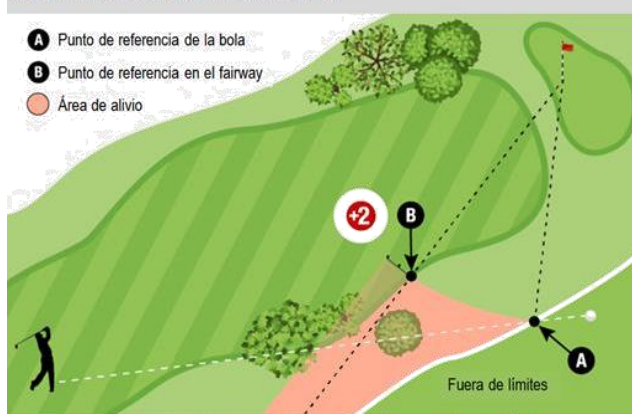
MRL E-5 DIAGRAMA 2: BOLA FUERA DE LÍMITES

Cuando se conoce o es virtualmente cierto que una bola de un jugador está fuera de límites, el jugador puede tomar alivio por golpe y distancia, o cuando el Modelo de Regla Local E-5 está vigente, el jugador tiene la opción adicional de dropear una bola dentro y jugar desde el área de alivio descrita abajo con dos golpes de penalización: