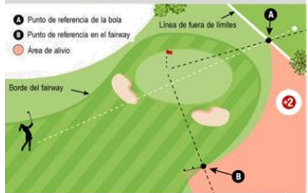
MRL E-5 DIAGRAMA 3: BOLA PERDIDA O FUERA DE LÍMITES CERCA DEL GREEN

Cuando se conoce o es virtualmente cierto que una bola de un jugador está fuera de límites, el jugador puede tomar alivio por golpe y distancia, o cuando el Modelo de Regla Local E-5 está vigente, el jugador tiene la opción adicional de dropear una bola dentro y jugar desde el área de alivio descrita abajo con dos golpes de penalización: